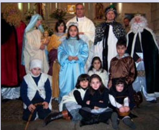
Belén viviente de la parroquia de Señorín

El belén instalado en Salesianos contaba con un sistema de iluminación que simulaba las diferentes horas del día.