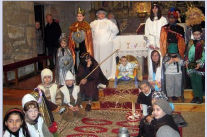
Belén viviente de la parroquia de Canedo