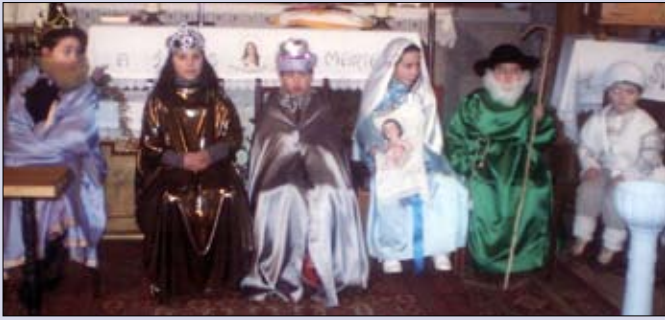
Nacimiento viviente de Monterrey