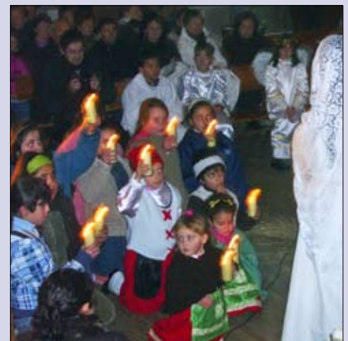
Representación teatral del Nacimiento del Señor en la parroquia de Bande

Los niños de los colegios de Sarreaus y Vilar de Barrio organizaron un concurso de postales de Navidad y Belenes.