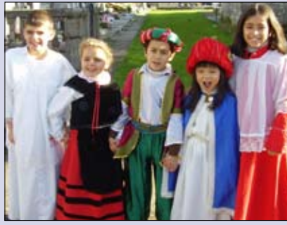
Belén viviente de los niños de la parroquia de Poulo.