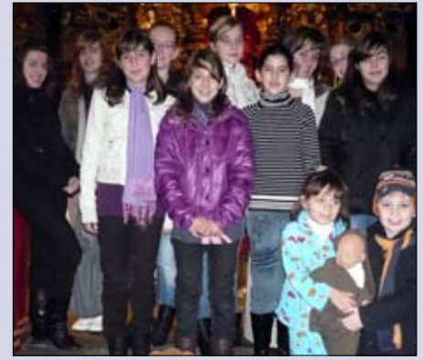
Escenificación navideña en Celanova