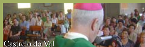
Castrelo do Val