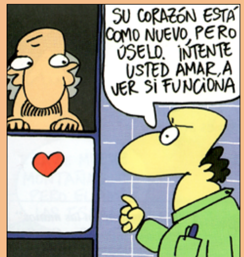
Viñetas del calendario de los Religiosos Camilos - 2009

Delegado de Medios: Jorge E. Estévez Álvarez