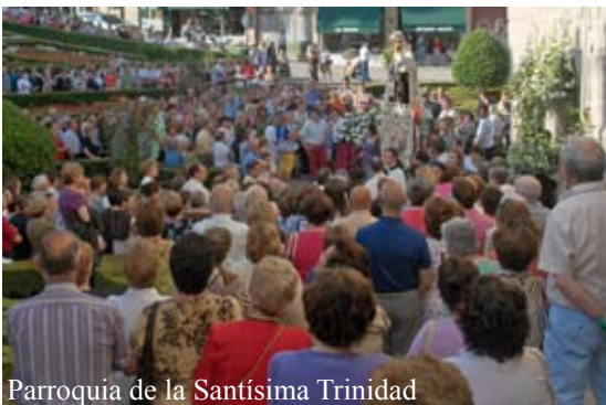
Parroquia de la Santísima Trinidad

N UMEROSAS parroquias de nuestra Diócesis celebraban el día 16 de julio, después de su Novena, la fiesta de Nuestra Señora del Carmen, patrona de las gentes del mar. La devoción a María bajo la advocación de la Virgen del Carmen es una de las más extendidas en el mundo y de las más arraigadas en la Diócesis de Ourense. ■