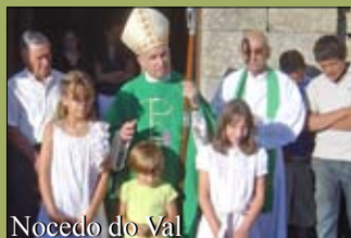
Nocedo do Val