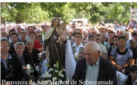
Parroquia de San Mamed de Sobreganade