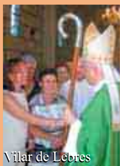
Vilar de Lebres