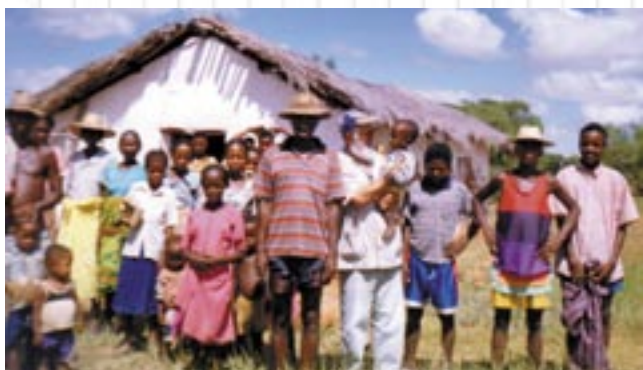
En el reverso de la foto nos habla de la historia de esta comunidad de Androi (Madagascar) y termina: “Tenednos presentes ante el Sagrario”