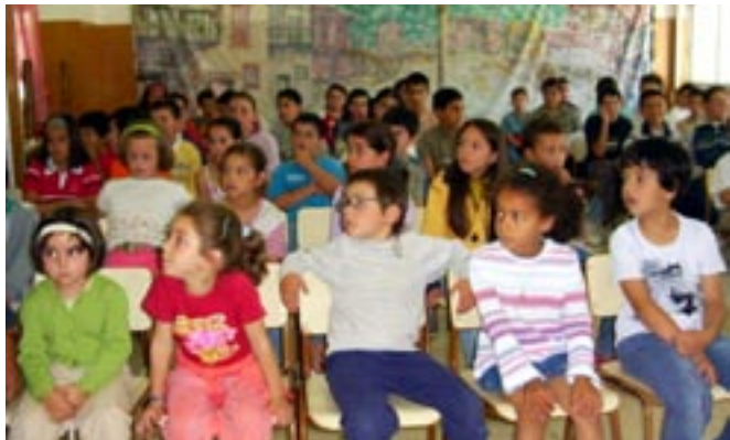
Alumnos de religión

A finales de enero, los profesores de Primaria y Secundaria volvían a reunirse en una nueva Jornada de Formación sobre Medios de Comunicación: cómo motivar en el aula .