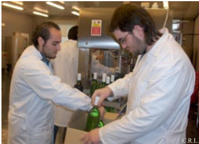
Alumnos del Centro de FP

Cristina Rodríguez López / Oficina de Prensa