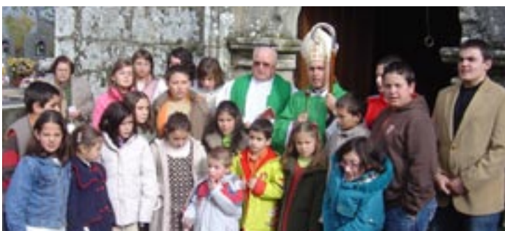
San Salvador de Sabucedo de Limia

E L domingo día 4 de febrero el Obispo de Ourense inicia la Visita Pastoral a las parroquias del Arciprestazgo de Ourense Norte con su presencia en San Miguel de Canedo y Santa Ana del Pino, mientras el domingo día 11 estará en La Purísima Concepción de Vilar de Astrés y San Pedro de Cudeiro. Los días 24 y 25 de febrero, sábado y domingo, la Visita Pastoral se desarrollará en Santa Teresita del Veintiuno. ■