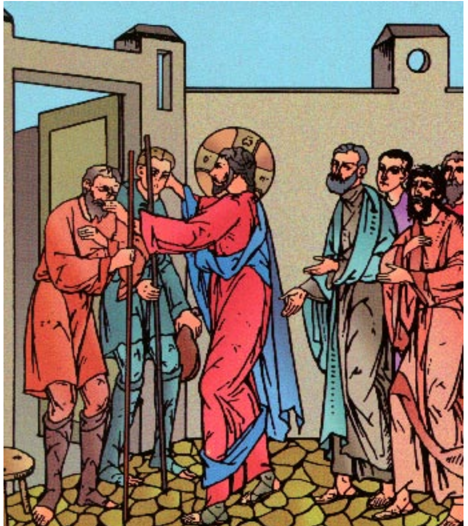
Imagen del cartel, tomada del Evangelionario bizantino-rumano, que presenta a Jesucristo curando con una mano a un sordo y con la otra mano a un mudo (Mc 7, 37)

Es necesario seguir practicando el ecumenismo espiritual que es el alma y el corazón de toda tarea ecuménica. El ecumenismo espiritual significa conversión interior, renovación del espíritu, santificación personal de la vida, pero también renovación de la Iglesia. Y, sobre todo, la oración personal y comunitaria. En este sentido tiene mucha importancia reavivar en el seno de nuestras comunidades cristianas aquella oración que el Se-