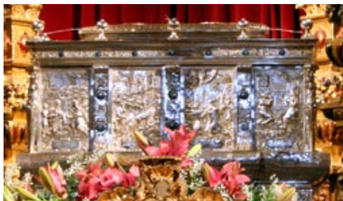
Urna con las reliquias de San Rosendo

Fragmento de la Carta Pastoral del Sr. Obispo de Ourense con motivo del Año Jubilar. ■