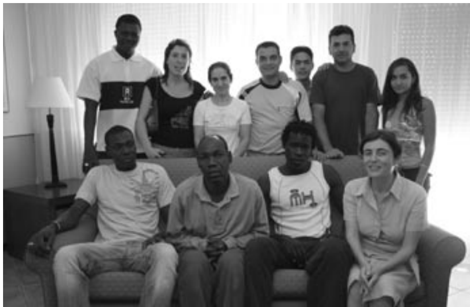
Piso de Cáritas Diocesana para la atención de inmigrantes

LA Comisión Episcopal de Migraciones, con motivo del Día de las Migraciones que se celebra 14 de enero, anima a los católicos a “ adoptar una actitud de cordial acogida y de relaciones fraternas con las familias inmigrantes ”. La familia inmigrante sufre por las especiales dificultades que vive, como separación, desarraigo, aprendizaje del nuevo idioma y adaptación al nuevo ambiente, por lo que han de ser objeto de preocupación de la Iglesia, para que todos consigamos que se sientan en familia. ■