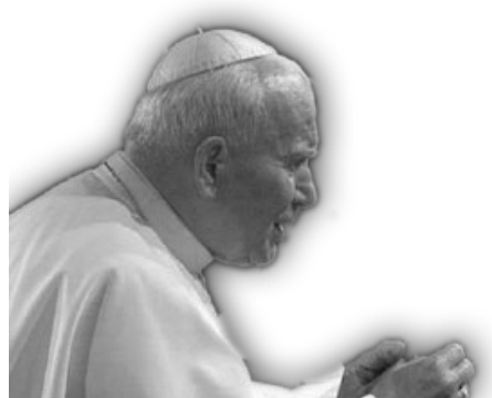
Juan Pablo II en 1997 en el encuentro de Río de Janeiro