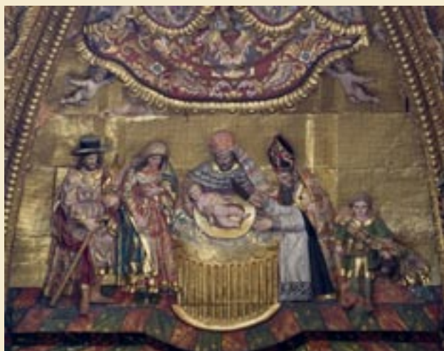
Circuncisión del Señor. Francisco de Castro Canseco. Hacia 1705. Retablo Mayor, Celanova (Ourense)