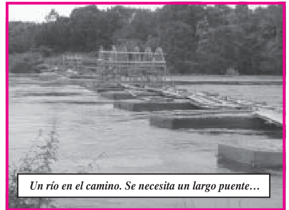
Un río en el camino. Se necesita un largo puente...

El cansancio se convierte en fatiga casi insuperable (la edad media de los misioneros es de 60 años). Lo cierto es que estos viajes no tienen nada de románticos.