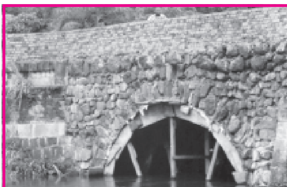
Puente de un arco, recién terminado