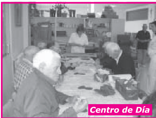
Centro de Día